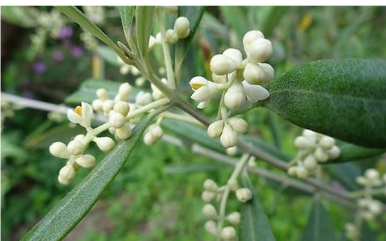
ミニトマトの花、新しく移植したオリーブの花