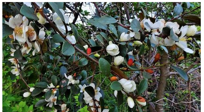
オガタマノキの花からイイ香り