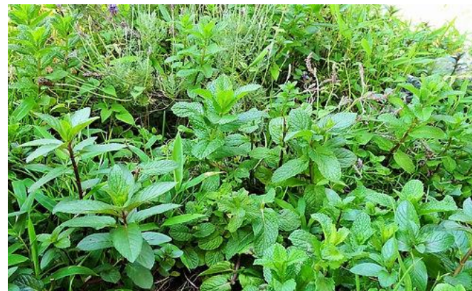
サツマイモ・紅はるか生育中、アピオスのピラミッド仕立て、ペパーミントとスペアミント葉盛り。