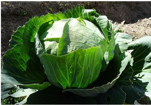
遅くまでゆっくり巻いたキャベツ