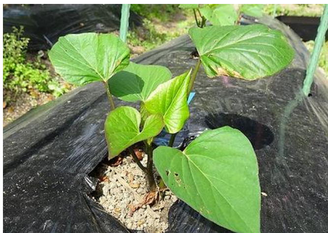
前年採っておいたヤーコンの株を分けて植えた～葉が広がってゆく。