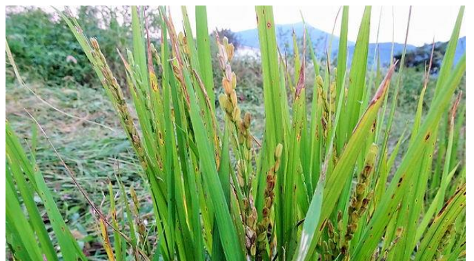
試作～乾田に蒔いた米・恋の予感が育っていた