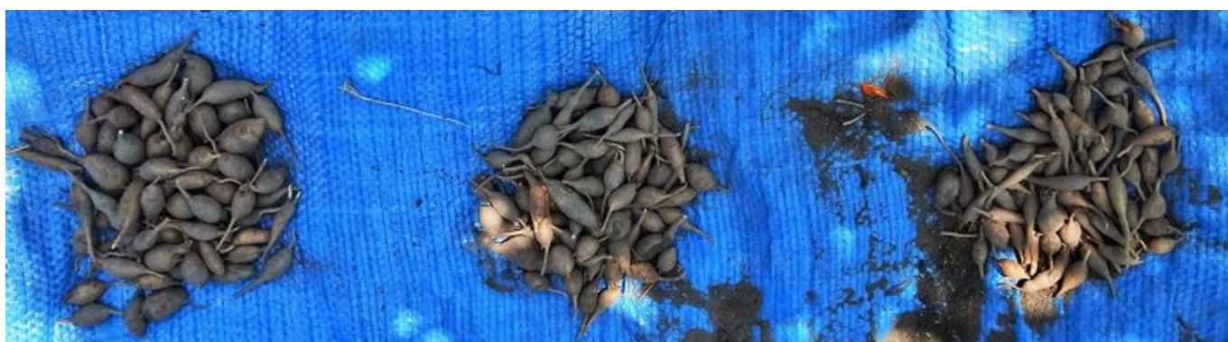
アピオス約600個定植