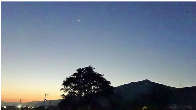
赤星山と夜明けの金星