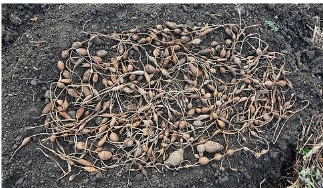
アピオスを掘り出す (種芋としてこれから植える予定)