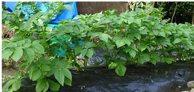
ジャガイモの花が咲いた。