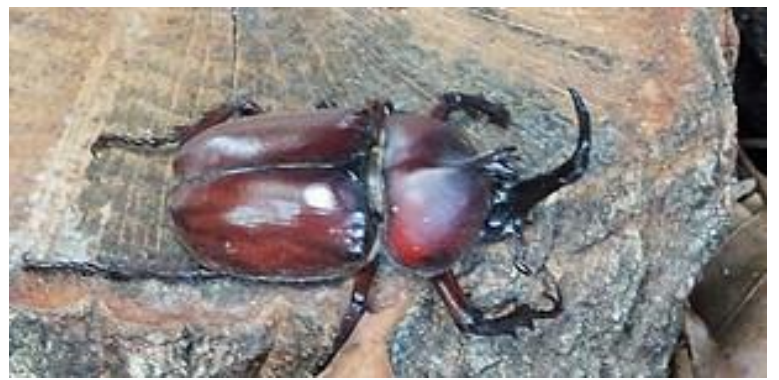
ミニトマト、キャベツ、サツマイモ、ヤマノイモ、ヤーコン成長中。 カブトムシが出て来た。現在3匹。